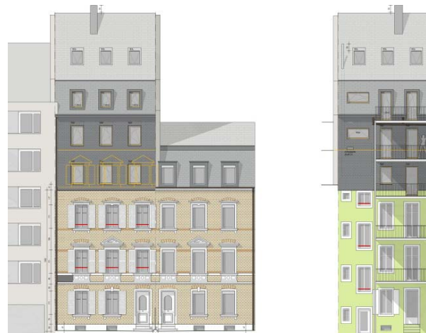
Vorschlag zu den Fassaden