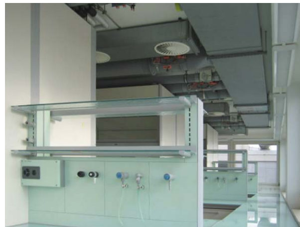
Laborarbeitsplätze entlang der Fassade