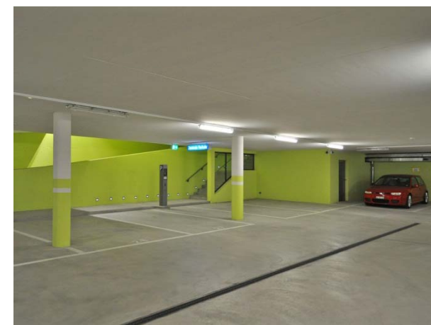
Einstellhalle mit Blick zum Ausgang