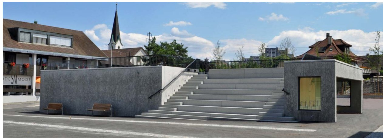
Einfahrtsgebäude mit Tribüne und Unterstand

Wettbewerb 1.Preis in Zusammenarbeit mit Rolf W. Voellmin, Basel.