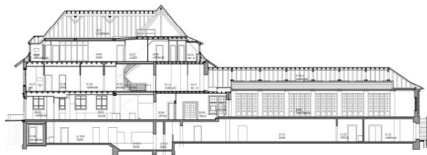
Schnitt durch Seitenflügel, Hauptgebäude und Gartensaal