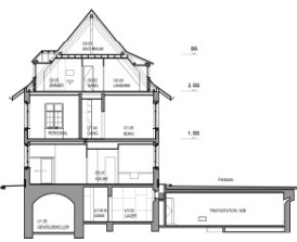
Schnitt durch Hauptgebäude