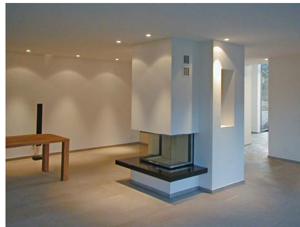
Wohnen / Essen mit Kamin