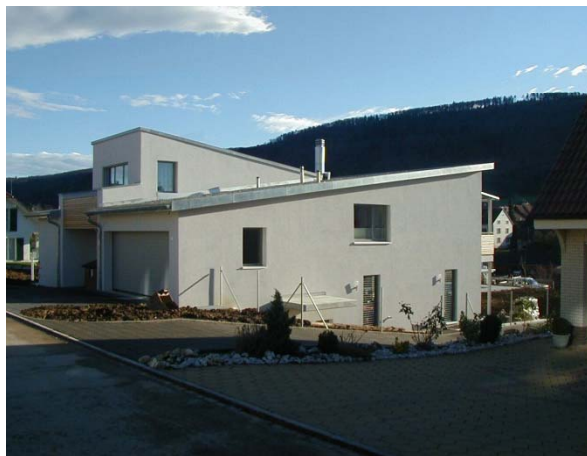
Haus aus Sicht Rauracherweg