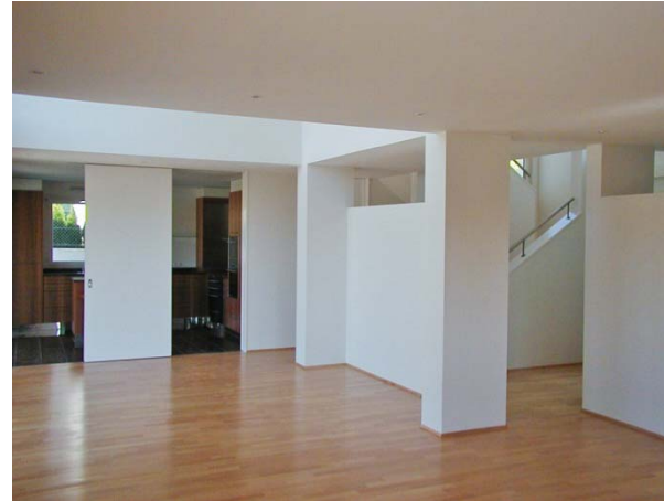
Wohnraum mit Blick zu Küche, Luftraum und Eingang

Aufgabe: Neubau eines Einfamilienhauses mit Wintergarten. Wohnraum mit Luftraum ins Obergeschoss. Pultdach mit Stehfalzeindeckung.